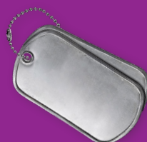
Defensie & Internationale Veiligheid