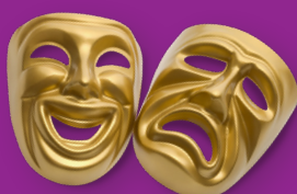
Cultuur en (Social) Media