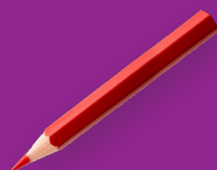
Bestuurlijke vernieuwing en directe democratie