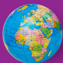
Immigratie en integratie