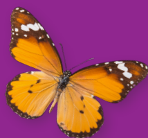
Milieu, Klimaat & Duurzaamheid